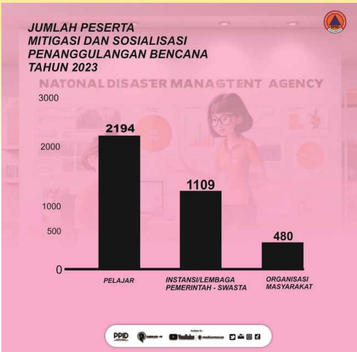
Grafik - Mitigasi serta Sosialisasi, Edukasi Bencana Tingkat Pelajar, Instansi baik Pemerintah & Swasta, serta Organisasi Masyarakat Wilayah Kota Madiun Tahun 2023