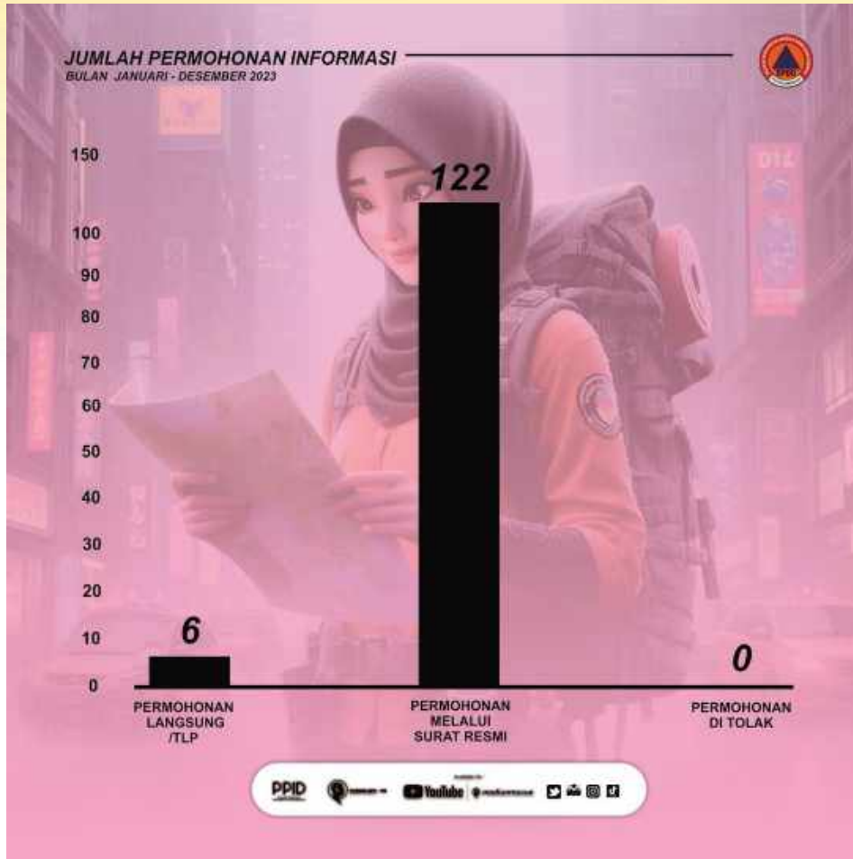
Gambar : Jumlah pengaduan berdasarkan jenis pelaporan Tahun 2023